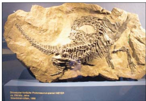
258 Millionen Jahre alt ist dieses Dinosaurier-Fossil. Die Ausstellung in Münster wird aufgrund der guten Resonanz verlängert.